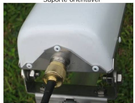
Conetor N femea

* A antena è compativel com qualquer Ruoter, Acess Point ou placa PCI e USB wi-fi. E' capaz de estender a cobertura do proprio Spot Wireless alem de 200%. Desta maneira voce pode ter um conexaso, sem fios muito mais robusta e estavel e a distancia sensivelmente superior daquelas antenas tradicionais.