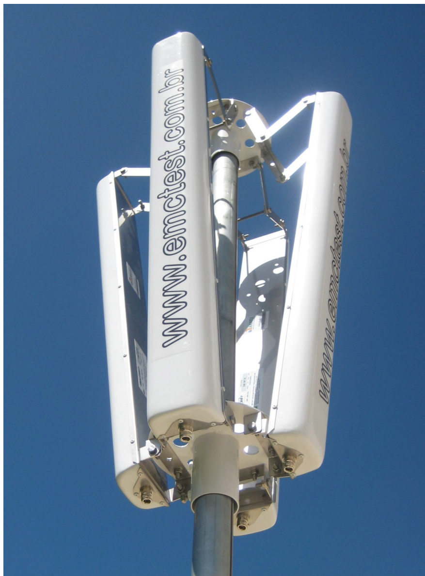
CLUSTER OMNIDIRECIONAL 4x EMC WF-20

Entao o que vc esta esperando venha ja fazer parte desta nova tecnologia!!